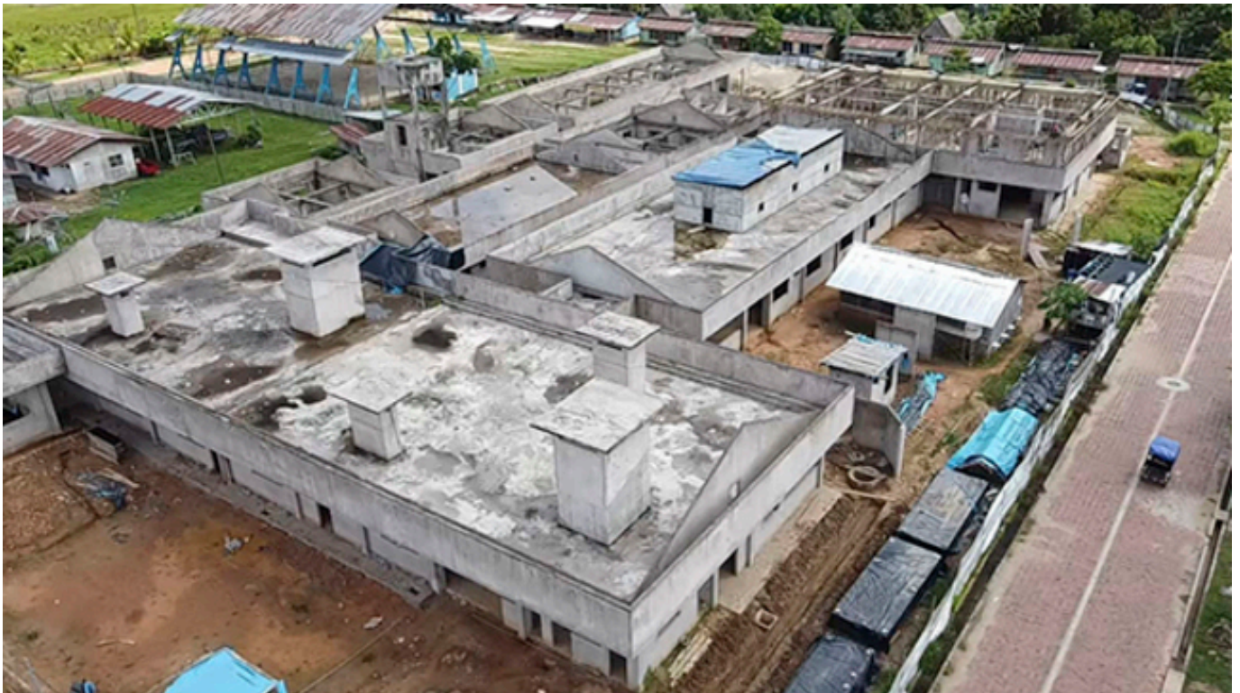
Construcción de establecimiento de salud ha presentado paralizaciones.

Una de las principales demandas que se extiende desde las comunidades nativas de la zona es la construcción del Hospital de Purús, cuyo avance ha sido paralizado varias veces.