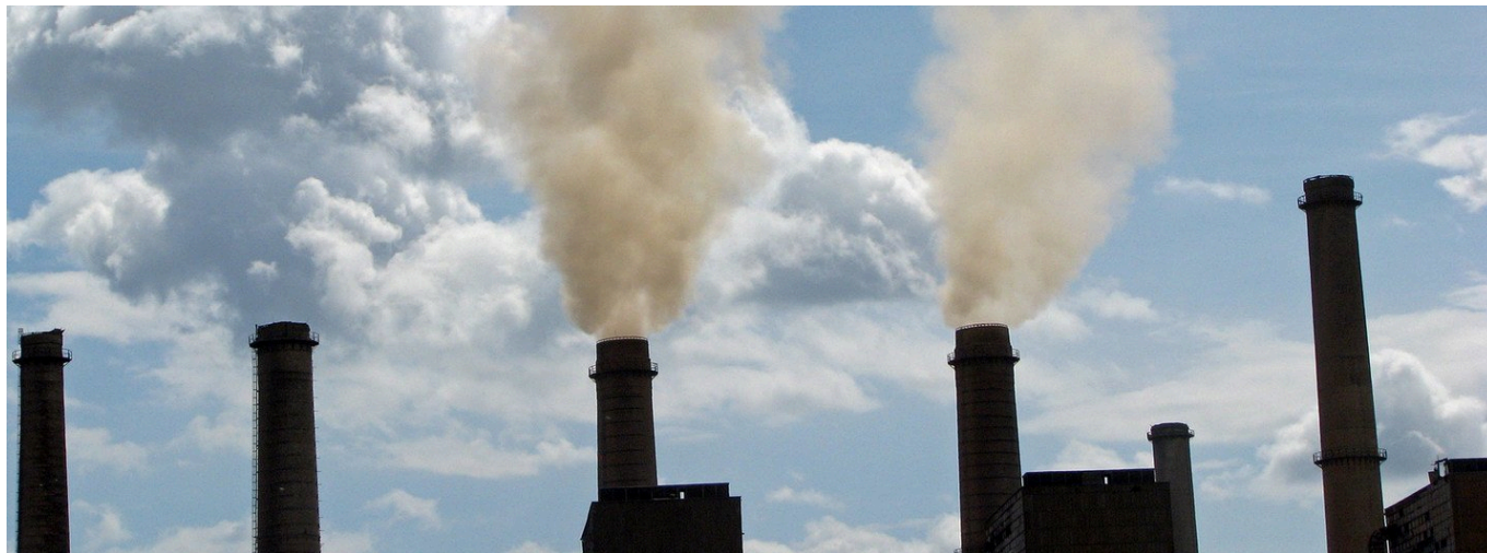
La región de América Latina y el Caribe arroja a la atmósfera 371 millones de toneladas métricas de dióxido de carbono por el consumo de madera y carbón.

De igual modo, destacó el aporte de los científicos que desarrollan vacunas en un tiempo récord, y a los países que asumen nuevos compromisos para prevenir la catástrofe climática.