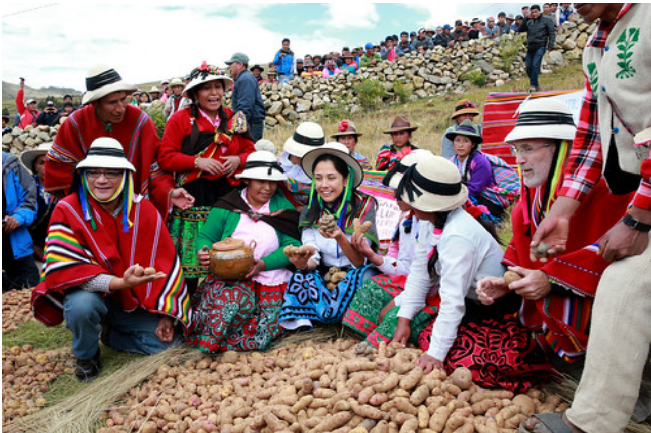
Primera Dama Nadine Heredia en comunidad de Yuricancha