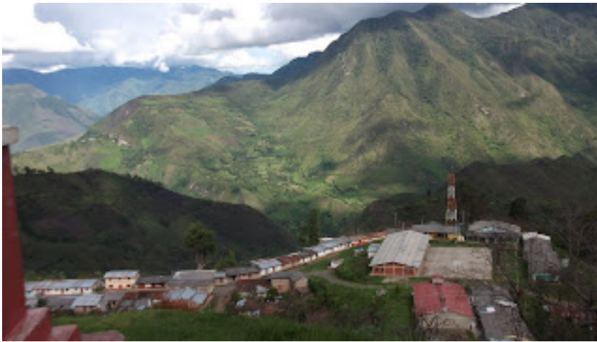
Imagen y mapa:

http://resguardodevitoncoafm.blogspot.com/ [2]