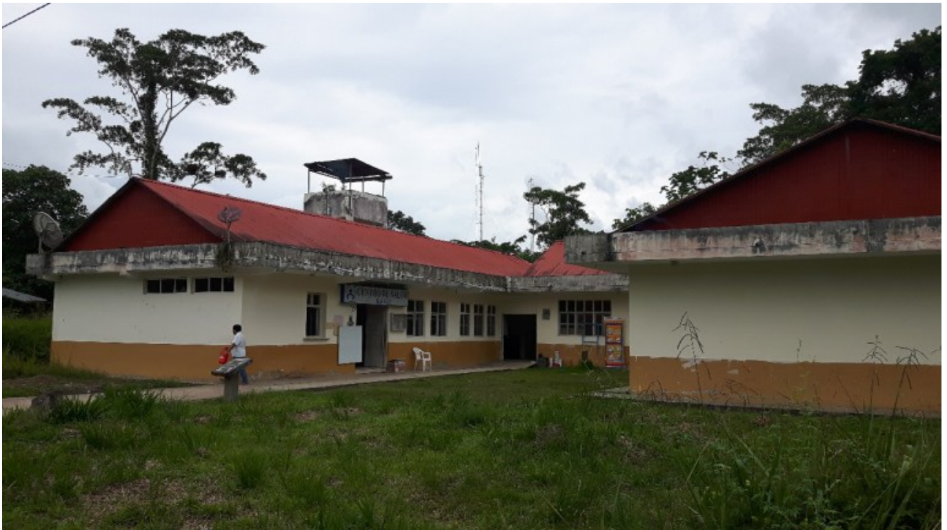
Puesto de salud de Puerto Galilea, categoría I-3