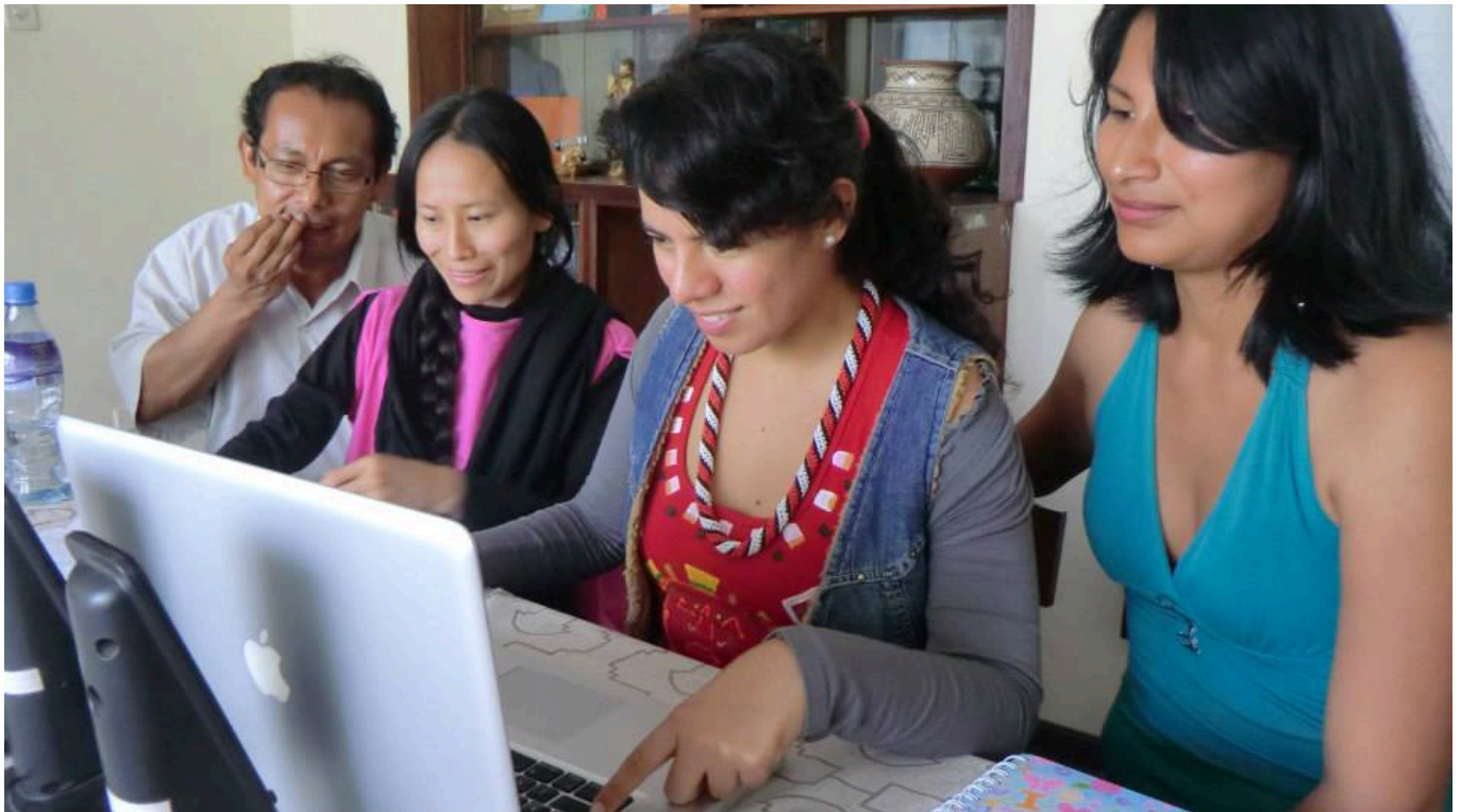
Editando "Nakawe Ashaninkapaye"