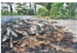
Foto 1. Rípiro de perforación en el pozo Palo Azul B

contaminada se infiltre en las capas más inferiores y contamine el agua del subsuelo. Según testimonios, el caucho colocado encima del hoyo no impide que el agua de lluvia penetre en el suelo y se mezcle con los desechos. Los petroleros dicen que el agua con hidrocarburo fluye por un tubo y llega a una cuneta o trampa donde el hidrocarburo se queda atrapado. Pero los trabajadores aseguran que el hidrocarburo se filtra, contaminando los esteros y riachuelos aledaños.